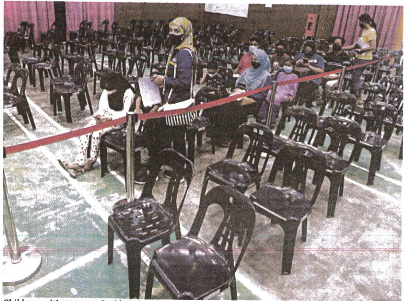
Children waiting to get a Covid-19 shot at a vaccination centre in Seberang Jaya, Penang, yesterday.

Page 1 pic: Commuters disembarking from a train at the Pasar Seni light rail transit station in Kuala Lumpur yesterday.