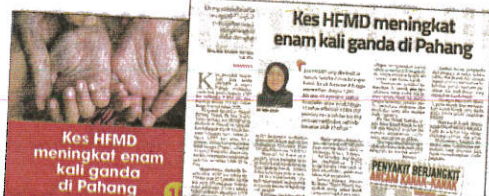
Laporan Sinar Harian pada Rabu.

HFMD banyak berlaku dalam kalangan kanak-kanak berusia antara bayi kurang setahun hingga enam tahun iaitu sebanyak 21,508 kes (96 peratus) diikuti kumpulan usia antara tujuh hingga 12 tahun iaitu 729 kes (3 peratus) dan selebihnya dalam lingkungan usia lebih 12 tahun.