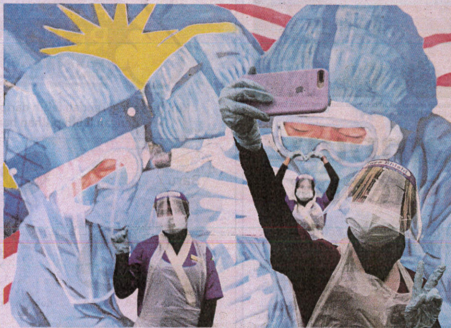
PENGORBANAN dan komitmen tinggi jururawat ditunjukkan ketika negara bergelut dengan penularan koronavirus.

Perasaan belas serta kasih terhadap pesakit ja-