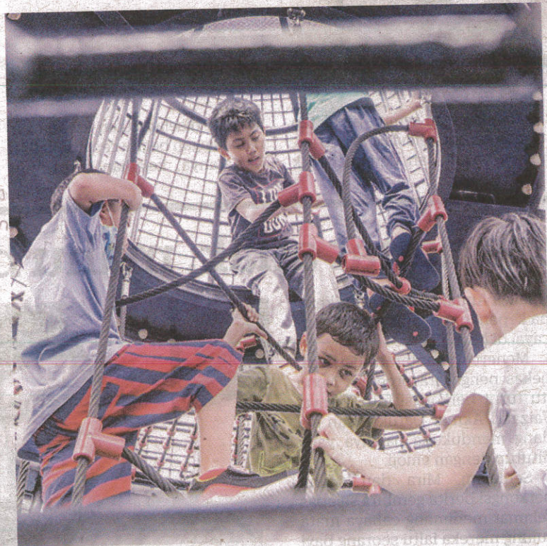
SEKUMPULAN kanak-kanak bermain di taman permainan di Taman Tasik Titiwangsa, Kuala Lumpur baru-baru ini.

Selain itu, enam kes kematian Covid-19 dilaporkan menjadikan jumlah kematian terkini sebanyak 35,590 kes serta tiga kes meninggal dunia di luar hospital atau brought-in-dead (BID) dengan